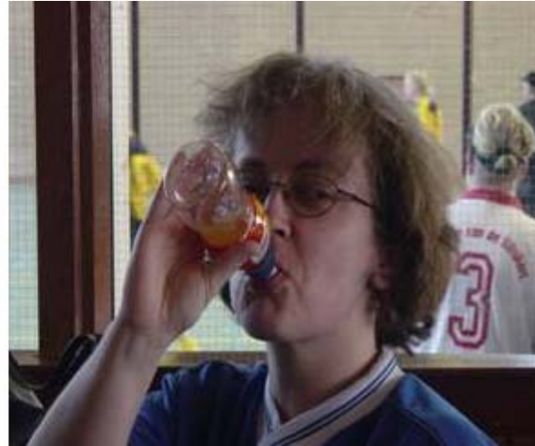
Er werd heel wat af gedronken !