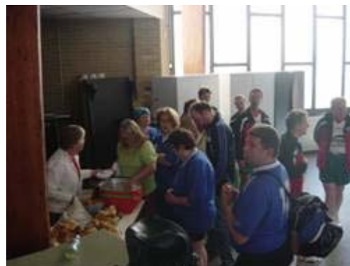
Het team van Havas aan het overgooien, en met z`n alle een broodje eten !