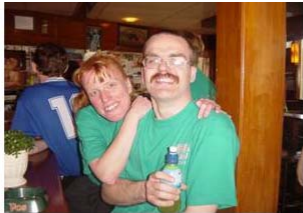
Roda deed voor de tweede keer weer mee, zij zijn nieuw en gezellig !