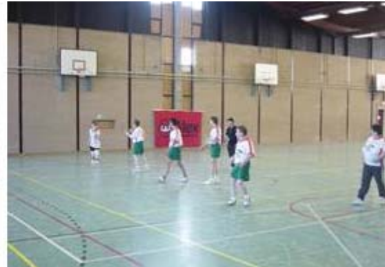
Koedijk tegen de Blinkert, een spannende wedstrijd !