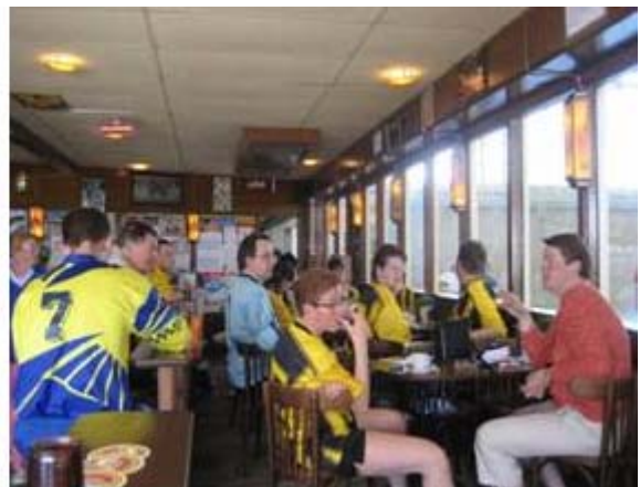
Aan de bar de consumptiebonnen uit geven en uitrusten zoals Havas en Koedijk